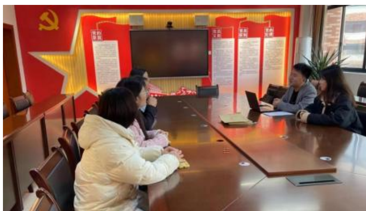
图 企开展学术 交 会 1