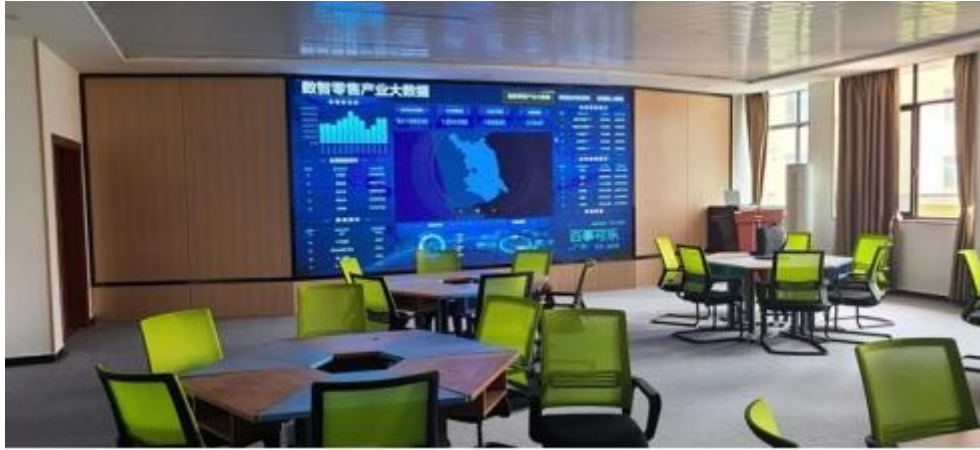
图 智慧 售 中心