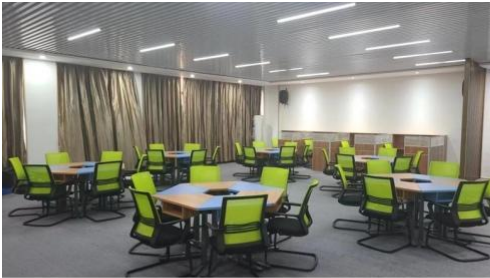
图 智慧 售 中心