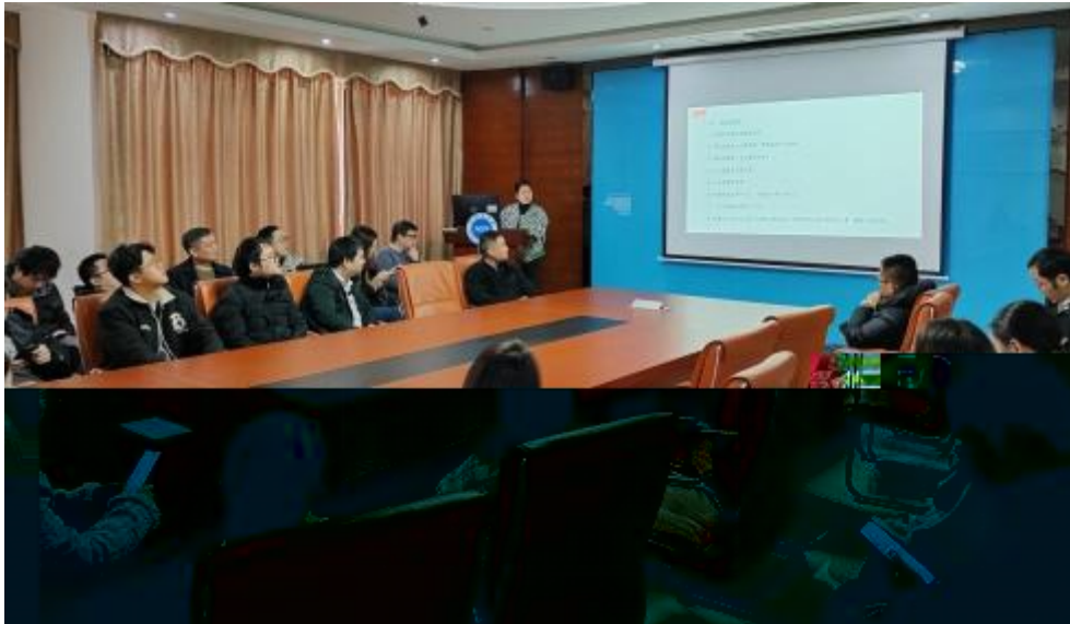
图 员工专业技 培