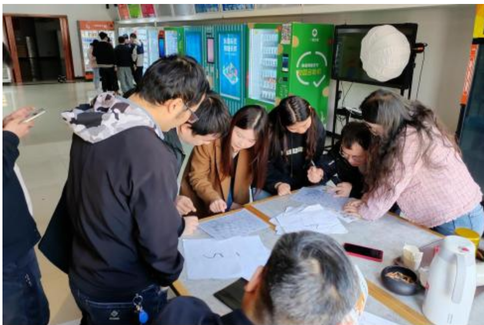
图 卓 团 建 共